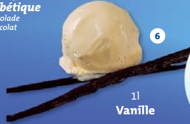
6 1l Vanille

Ijs zonder toegevoegde suiker : op basis van magere melk, voedingsvezels, maltitol en aspartaam Glace sans sucre ajouté: à base de lait écrémé, fibres, maltitol et aspartame.