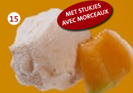
15 Meloen* Melon