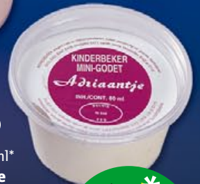
36 x 80ml* Vanille