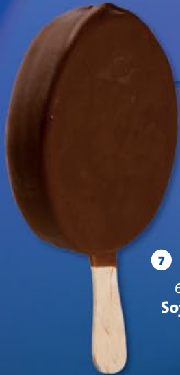
7 6 x 110ml Soja Goliath dark

SOJA-IJS 100% plantaardig, lactose-vrij, rijk aan eiwitten, mineralen en vitamines GLACE AU SOJA 100% végétale, sans lactose, riche en protéines, minéraux et vitamines.