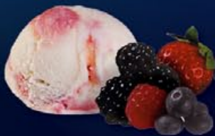
10 Yoghourt ijs Glace yaourt met bosvruchten coullis au coullis fruits des bois Glace au yaourt