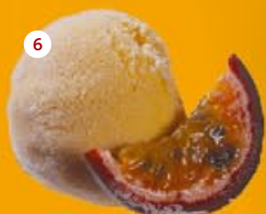
6 Passievruchten* Fruits de la passion