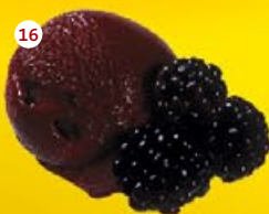
16 Bosbessen* Myrtilles