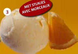
3 Sinaas Orange