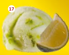
17 Groene limoen* Citron vert