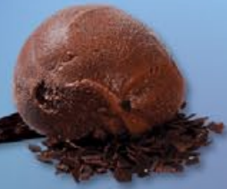
9 Soja-ijs chocolade Glace au soja chocolat