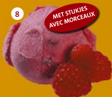
8 Frambozen* Framboise*