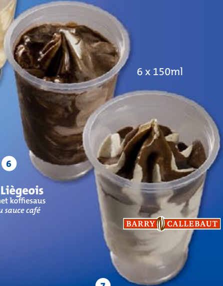
7 Coupe Speculatte resto speculaas met een laagje origine melkchocolade 'Arribe' resto spéculoos avec une couche de chocolat au lait d'origine 'Arribe'