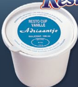
13 24 x 120ml Restocup vanille