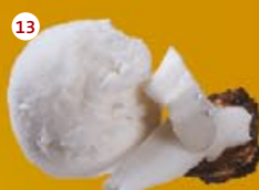
13 Kokos* Coconut