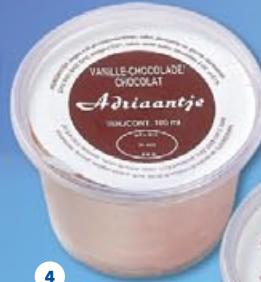
4 Diacup chocolade chocolat