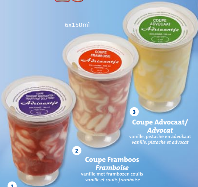
1 Yoghourt-bosbessen ijs Glace yaourt-myrtilles