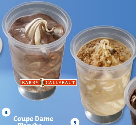
4 Coupe Dame Blanche vanille met chocolade saus vanille au sauce de chocolat