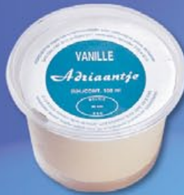
3 Diacup vanille