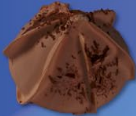
2 4 X 150ml Dia-ijsgebakje Tartelette diabétique Vanille en chocolade Vanille en chocolat