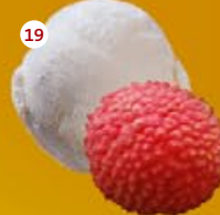
19 Lychee Litchi

Deze smaken zijn verkrijgbaar in doosjes 2,5L / Les parfums suivant existent en boîtes de 2,5L