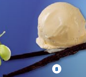
8 Soja-ijs vanille Glace au soja vanille