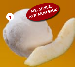
4 Peren* Poire