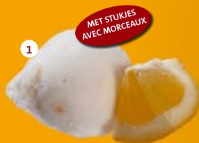
1 Citroen* Citron