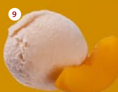
9 Perzik Pêche