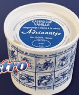
14 18 x 100ml Gastrocup vanille

* Eis met 10% vetgehalte Ice with 10% vegetable fat