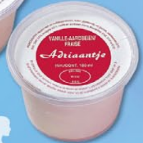
5 Diacup aardbeien fraise