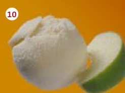
10 Groene appel Pomme vert