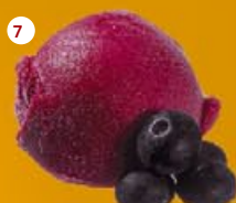
7 Zwarte bes* Cassis