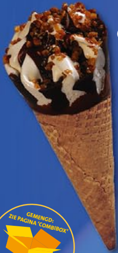
1 8 X 120 ml Cornet vanille

-40% CAL -60% VET-GRAISSE vergeleken met resto ijs comparé à la glace Resto