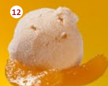
12 Abrikozen Abricot