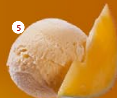
5 Mango* Mangue