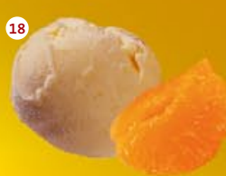
18 Mandarijn Mandarine