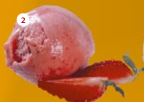
2 Aardbeien* Fraise